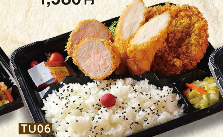
TU06 名物ささみカツ&一口ヒレカツ & 楽万ダンチカツ弁当 1,780円