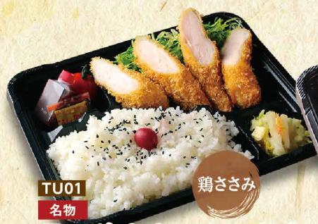
TU01 名物 鶏ささみ 匠の鶏ささみカツ弁当 1,280円