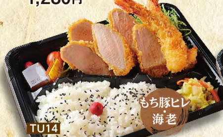
TU14 もち豚ヒレ 海老 特選もち豚ヒレカツ & 海老フライ弁当 2,110円