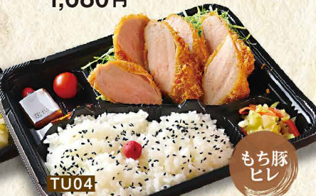
TU04 豚肉のシャトーブリアン使用 特選もち豚ヒレカツ弁当 1,780円