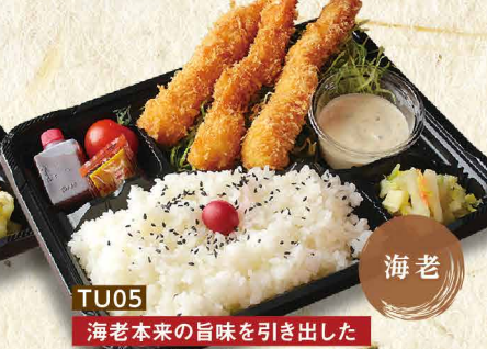
TU05 海老 特選海老フライ弁当 1,680円